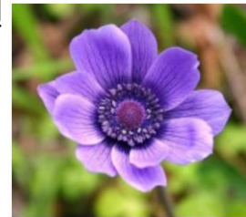
Anemone Coronaria L.