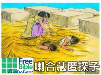
Free Bible Illustrations 喇合藏匿探子