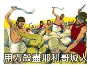
用刀殺盡耶利哥城人