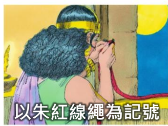
以朱紅線繩為記號